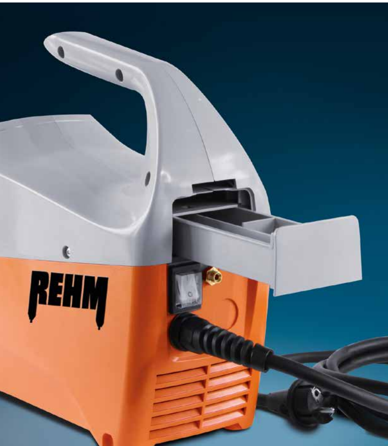
Die neue Schublade unterhalb des Griffs eignet sich hervorragend, um kleine Verbrauchsmaterialien wie WIG-Elektroden und Gasdüsen zu verstauen