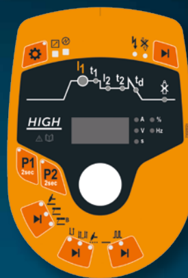
TIGER® HIGH DC 180 A / 230 A