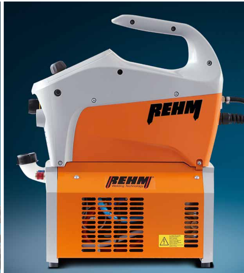
Alle Varianten sind mit integriertem Wasserkühlgerät erhältlich. Kompakt und leicht. Systemgewicht ab 15,7 kg